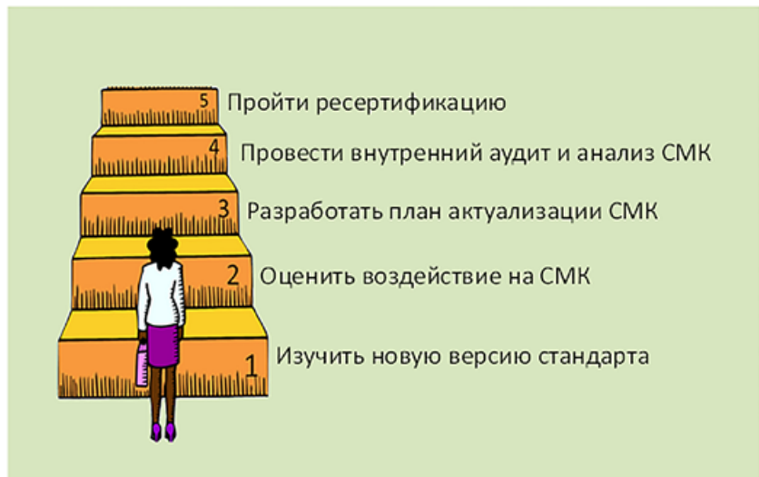
Рисунок 2. Этапы перехода на новую версию стандарта ИСО 9001

В общем, план перехода на новое издание стандарта ИСО 9001:2015 может выглядеть, как показано на рисунке 2. Целесообразно начинать все работы с изучения новой версии стандарта, например, посетив предлагаемые нами курсы семинаров. На следующем этапе следует оценить проект перехода на ИСО 9001:2015 с точки зрения воздействия на существующую систему менеджмента качества. После этого необходимо разработать детальный план актуализации СМК, в котором указать необходимые мероприятия, ответственность, сроки и ресурсы. Реализацию этого плана следует проверить, проведя внутренний аудит. Результаты внутреннего аудита анализируются руководством, в результате этого принимается решение по ресертификации СМК на соответствие требованиям ИСО 9001:2015.