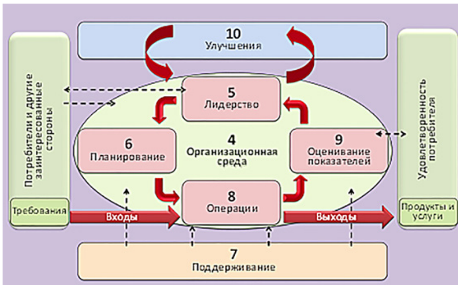
Рисунок 4. Новая модель ИСО 9001:2015

деле «9 Оценивание показателей». Информация по оцениванию показателей попадает к руководству в разделе «5 Лидерство», которое принимает решения. На основе руководящих решений разрабатываются цели и планы в разделе «6 Планирование», которые реализуются в основном процессе. Раздел «10 Улучшения» обеспечивает постоянное улучшение системы менеджмента качества, а раздел «7 Поддержание» обеспечивает ресурсами процессы.